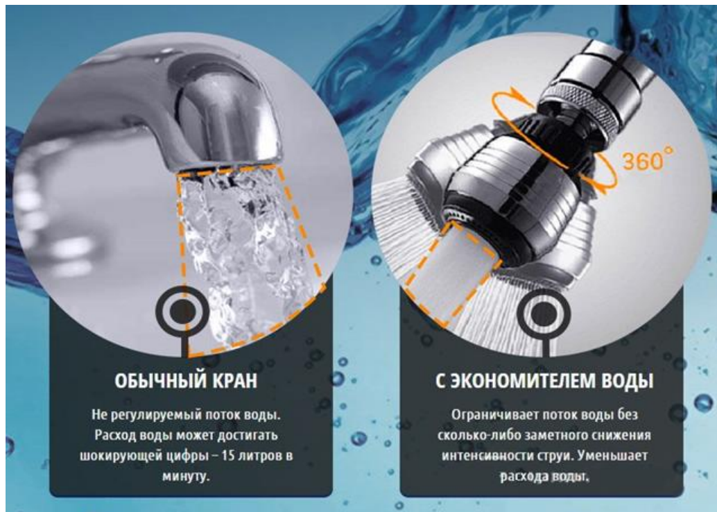
Рисунок 1 - Насадка-аэратор на кран

Поток воды, который протекает через сеточку аэратора, в месте заужения сосредотачивает давление. Расширительная мембрана с определенным количеством и диаметром отверстий, дает возможность воде равномерно распределить давление по диаметру всего аэратора. Поэтому, сверху расширительной мембраны создается область высокого давления, с обратной стороны мембраны, благодаря специальной форме, образует вакуум.